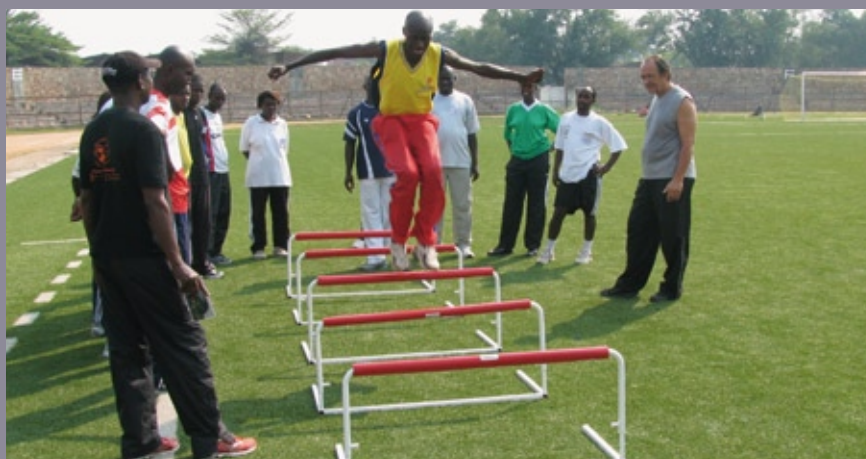
■ La détection de jeunes talents sportifs, un des axes forts du Programme Sport de la CONFEJES

Le Programme Sports comportait, en 2010, neuf (9) actions qui ont toutes été réalisées.