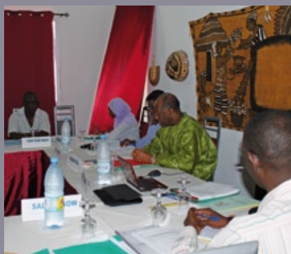
■ Retraite 2010 du personnel de la CONFJES (Saint Louis, juin 2010)