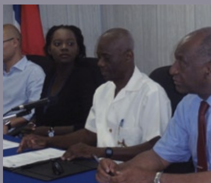
■ Signature d'une convention de financement du programme CONFEJES de solidarité active au bénéfice des jeunes de Haïti et session spéciale de formation sur le programme FIJ (Haïti, juin 2010)