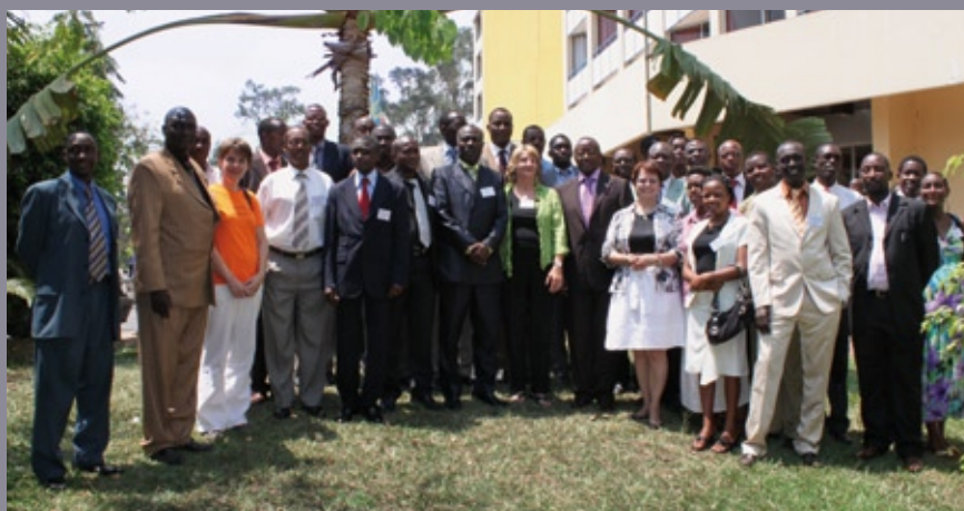
■ Séminaire de sensibilisation sur la Gestion axée sur les résultats (Bujumbura, octobre 2010)