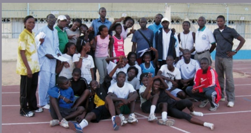
■ Stage de formation d'entraîneurs d'athlétisme en vue de la détection de jeunes talents (Dakar, novembre 2010)