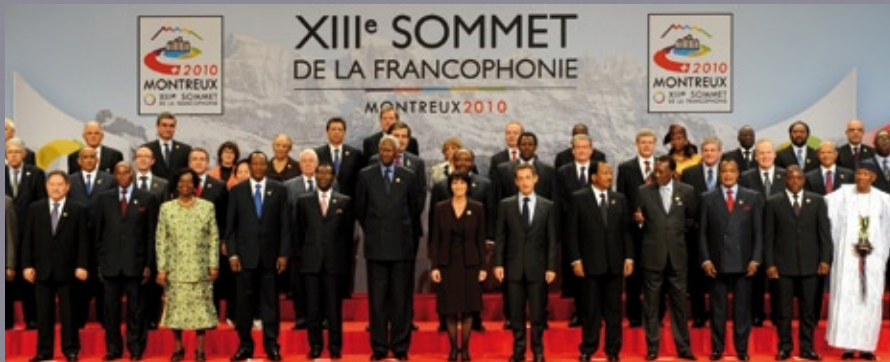
■ 13 ème Sommet de la Francophonie (Montreux, octobre 2010)

Du 19 au 21 mai 2010, s'est tenu à Ouagadougou (Burkina Faso) le 1 er Forum Ouest-Africain de Développement des Entreprises (Africallia), sous la présidence du Premier Ministre du Burkina Faso et en présence de M. Abdou Diouf, Secrétaire général de l'OIF et de M. Soumaïla Cisse, Président de la Commission de l'UEMOA. Le Secrétaire général de la CONFEJES était représenté par le Directeur des Programmes Jeunesse accompagné de trois (3) jeunes bénéficiaires du Programme FIJ.