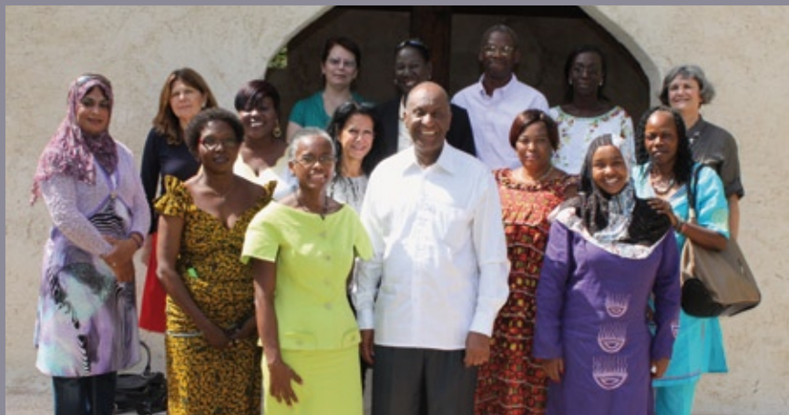
■ Réunion du GTCF (Saly-Portudal, novembre 2010)

Il ressort de l'analyse de la situation que d'importants efforts de sensibilisation devront être menés auprès des ministres pour favoriser l'égalité entre les genres et accorder une plus grande attention aux déléguées nationales du GTCF qu'ils ont eux-mêmes nommées.