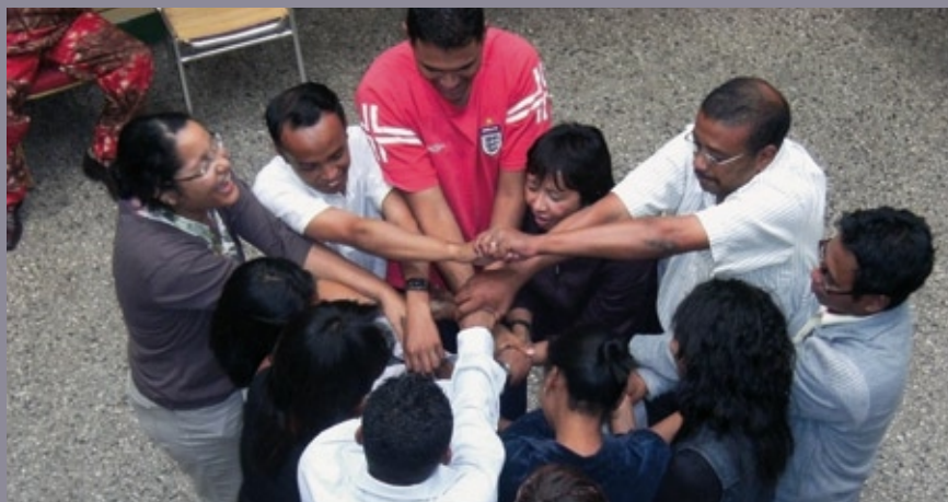
■ Jeunes leaders malgaches dans le cadre d'une formation en animation et gestion d'activités pour promouvoir la culture de la Paix et la citoyenneté

En plus de ces actions, il convient de souligner que des actions prévues en 2009 et d'autres qui n'étaient pas programmées ont été réalisées à la demande des pays ou des partenaires institutionnels.