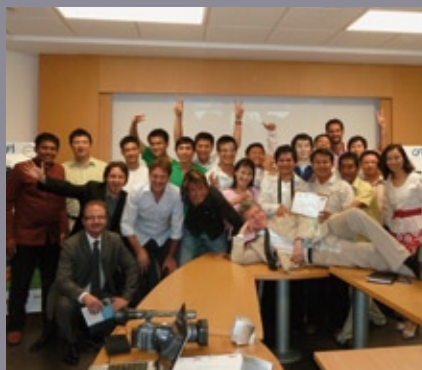
■ Partenariat avec CFI : formation de journalistes à la couverture d'un événement sportif avant la Coupe du monde de Football (Hanoï, mai 2010)