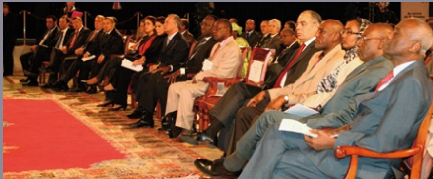
■ Cérémonie d'ouverture de la 9ème Réunion du Bureau de la CONFEJES

L'occasion est pour nous de remercier très vivement tous les États et gouvernements membres, en particulier les pays contributeurs, nos partenaires, nos commissaires aux comptes, les correspondants nationaux, les coordonnateurs du FIJ, les délégués du GTCF, les consultants ainsi que toute l'équipe CONFEJES pour l'aide précieuse qui nous a été apportée au cours de la présente année, et sans laquelle, il nous aurait été difficile d'atteindre de tels résultats.