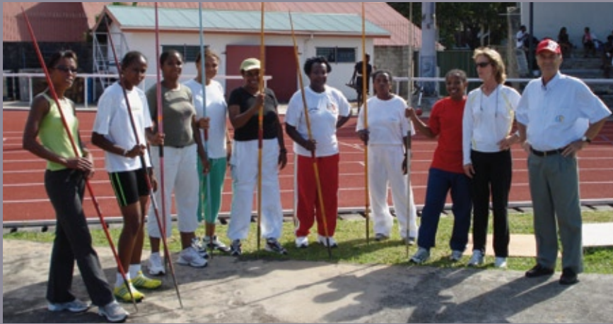
■ Encouragement des femmes à la pratique sportive et promotion des cadres féminins dans les Ministères de la Jeunesse et des Sports

En 2010, les deux (2) actions prévues dans la programmation ont été réalisées.