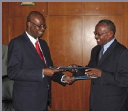
■ 54 ème session et Cinquantenaire de la CONFEMEN : signature de deux (2) conventions de partenariat avec la CONFEJES (Dakar, novembre 2010)