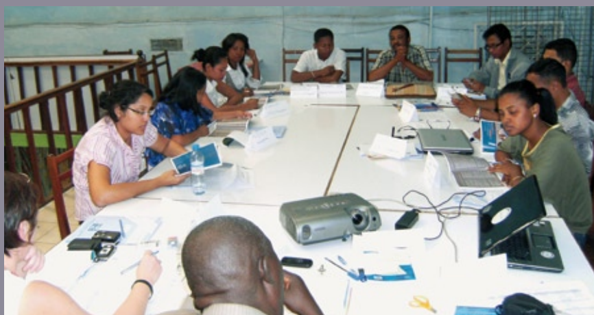
■ Séminaire de formation de formateurs en animation et gestion des activistes en vue de promouvoir la culture de la Paix et la citoyenneté (Antananarivo, novembre 2010)