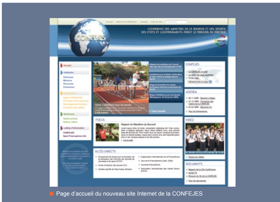
■ Page d'accueil du nouveau site Internet de la CONFEJES

Une refonte du site Internet vient d'être effectuée et le rend ainsi plus attractif et animé : meilleure mise en avant de l'information, galeries photos, vidéos, etc.