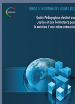
■ Guide pédagogique FIJ destiné aux jeunes et à leurs formateurs