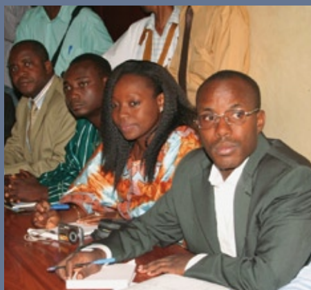
■ Forum des CNJ sur l'émigration clandestine dans les pays francophones de l'Afrique de l'Ouest (29 juin 2008, Mauritanie)