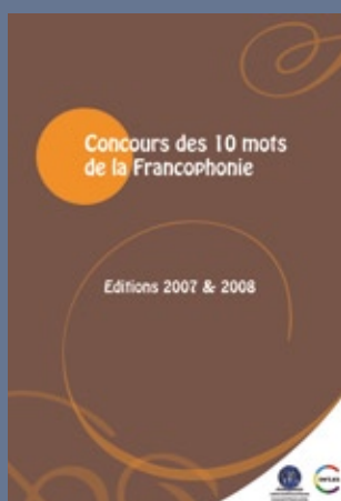
■ Edition du « Concours des 10 mots de la Francophonie », organisé par la CONFEMEN