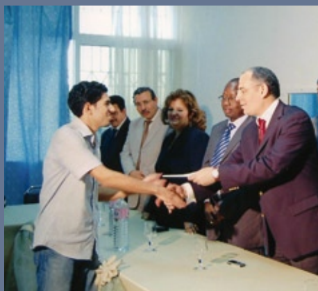
■ Remise de chèques aux jeunes tunisiens bénéficiaires du FIJ en 2008