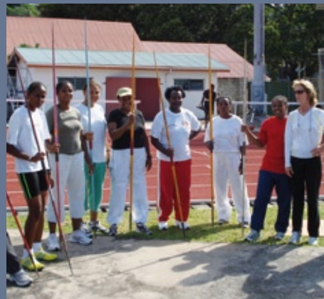
■ Stage de perfectionnement des cadres sportifs féminins de la CJSOI (12-16 mai 2008, Seychelles)