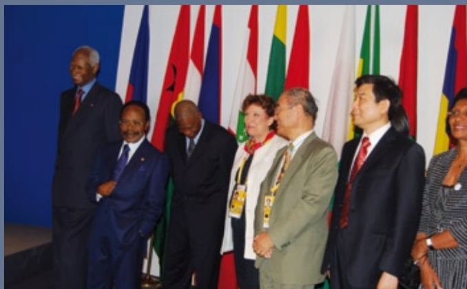
« Evènement Francophone » organisé pendant les Jeux Olympiques de Pékin par l'OIF avec la participation de la CONFEJES (09 août 2008, Chine)

Ces actions ont contribué à un rapprochement entre l'OIF et le Mouvement Sportif international et africain (CIO, Fédérations internationales, CNO, Confédérations africaines, etc).