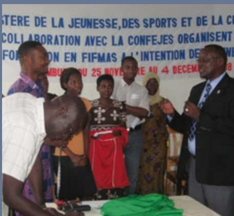
■ Session de formation FIFMAS organisée dans le cadre de la convention signée avec Olympafrica (29 novembre-6 décembre 2008, Burundi)