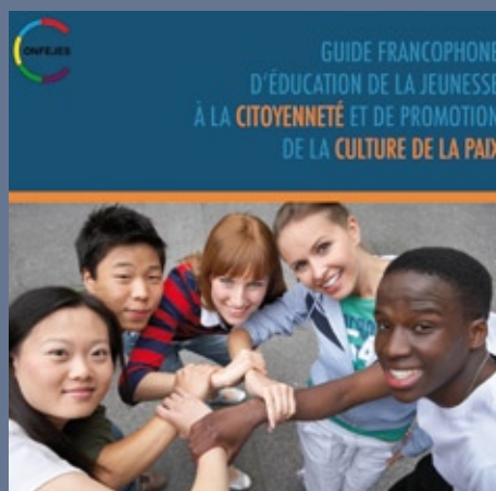
■ Publication d'un guide et de modules de formation sur la démocratie et la citoyenneté