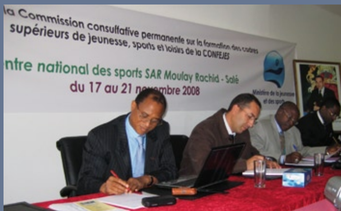
■ Réunion de la Commission Consultative Permanente sur la Formation des Cadres Supérieurs de la Jeunesse et des Sports (07-11 novembre 2008, Maroc)