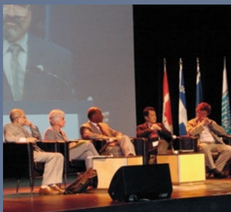
■ Xème Congrès Mondial du Loisir (06-10 octobre 2008, Canada)