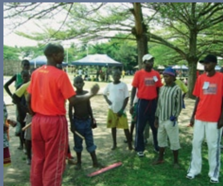
■ Animations sportives organisées dans le cadre des journées « Jeunesse-Sport-Paix » (décembre 2008, Burundi)