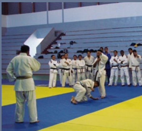
■ Club CONFEJES Judo (26 mai-4 juin, Madagascar)