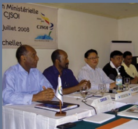
■ XXIIIème Session ministérielle de la CJSOI (29-30 juillet 2008, Seychelles)