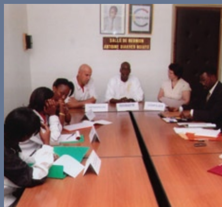
■ Stage de formation de cadres techniques féminins entraîneurs de tennis organisé en collaboration avec la CAT (07-18 décembre 2008, Sénégal)